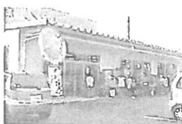
4月 売場オープン日の様子