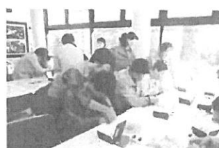
10月 工場見学旅行(山梨)