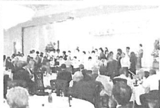
6月 創立20周年記念式典