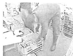
7月 施設外就労(梅収穫)