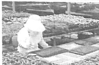
5月 花苗育苗(播種作業)