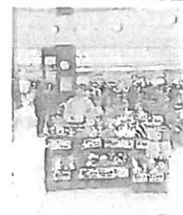
11月 ふれ愛販売会(けやき)